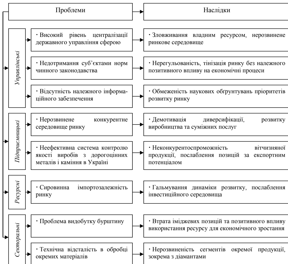
Рис. 2. Ключові проблеми розвитку вітчизняного ринку виробів з дорогоцінних металів і каміння: сучасний контекст